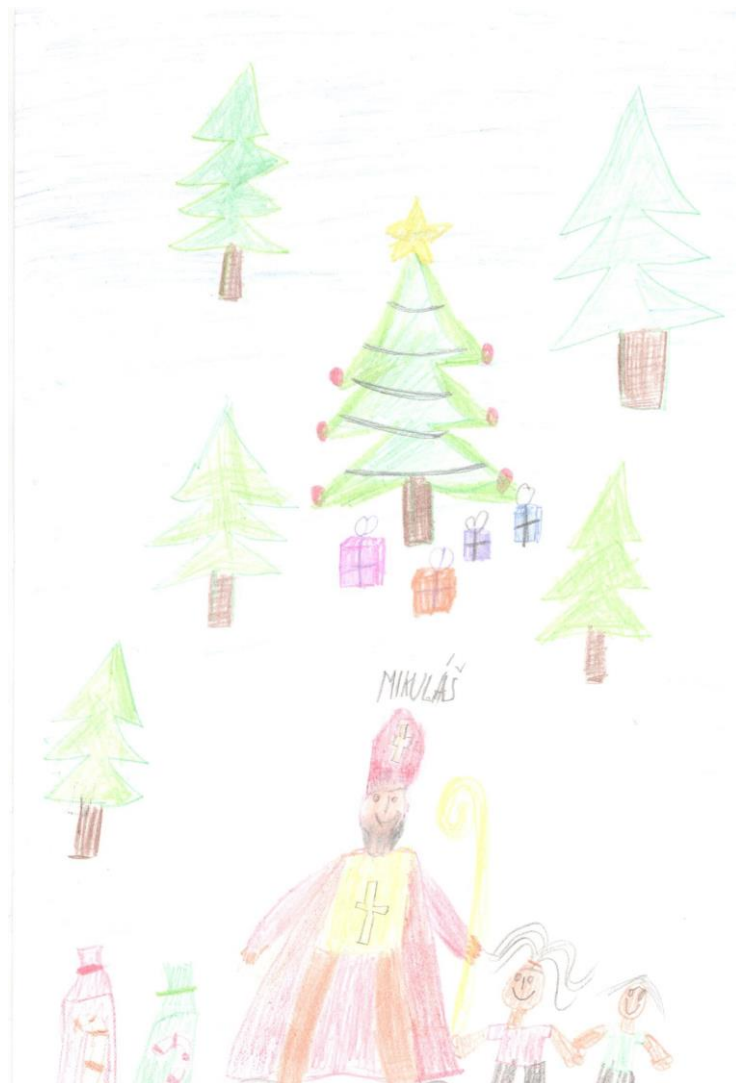
Ilustrácia: Livka Skukáľková, 2.A