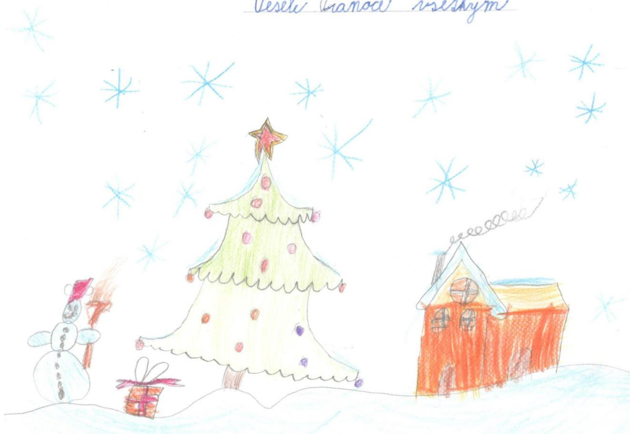
Ilustrácia: Bianka Skukáľková, 2.A